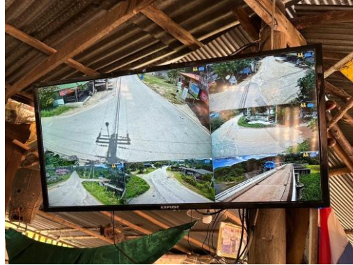
โครงการปรับปรุงระบบกล้องโทรทัศน์วงจรปิด (CCTV) ภายในเขต อบต. หมู่ที่ ๕